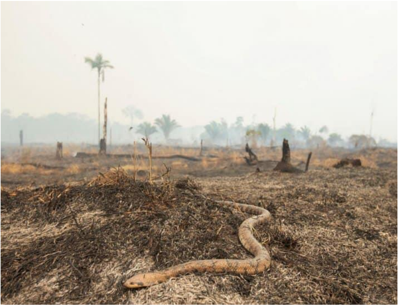
Obr 4. Had se snaží uniknout z ohnivé zkázy