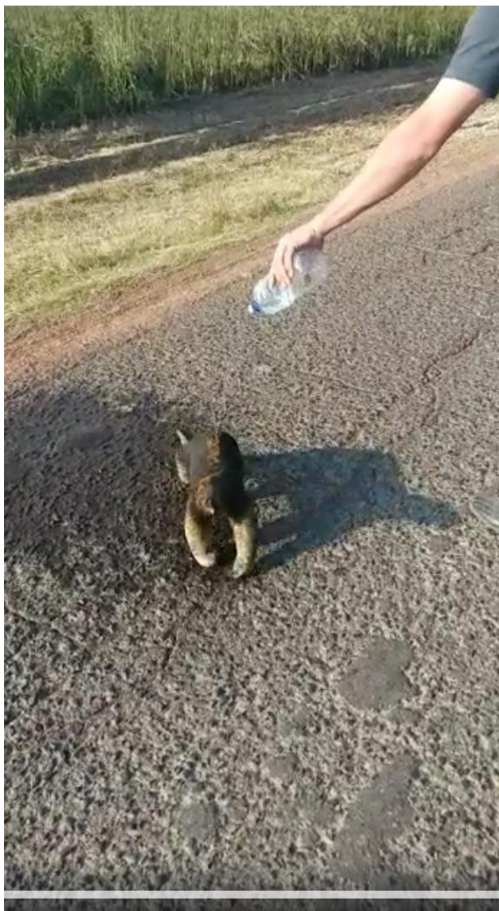
Obr. 6 – Hašení ohořelé tamanduy.