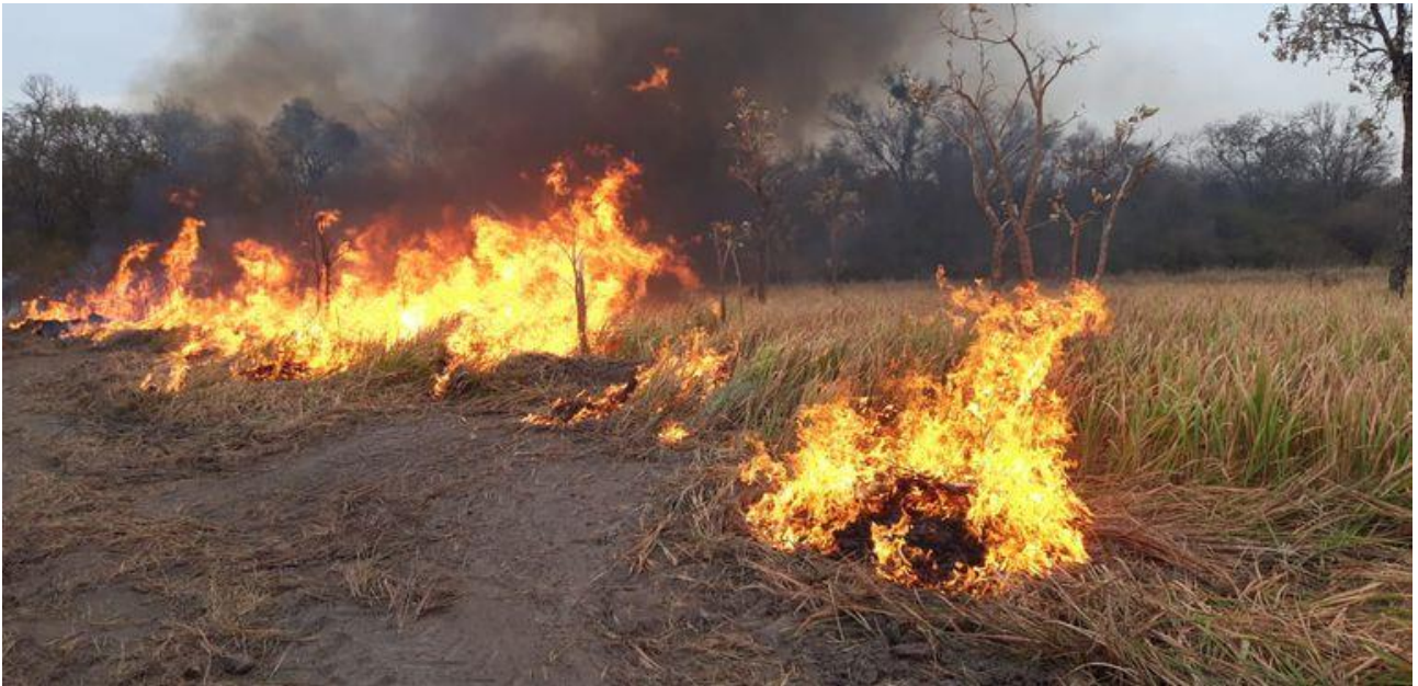
Obr.7 Požár 25.8.2019 překonal hranice z Bolivijské strany.