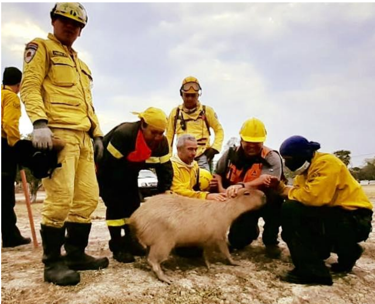
Obr. 5 Tato kapybara měla štěstí – jedna z mála zachráněná.