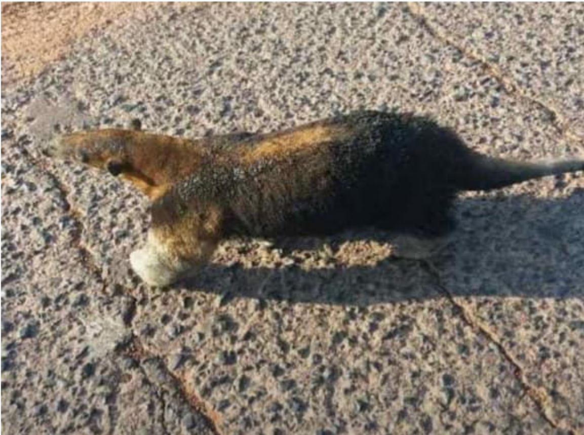
Obr. 3 Tamandua nalezen v blízkosti požáru .

Země je naším společným domovem, je naší povinností ji chránit – pojďme jí společně pomoci.